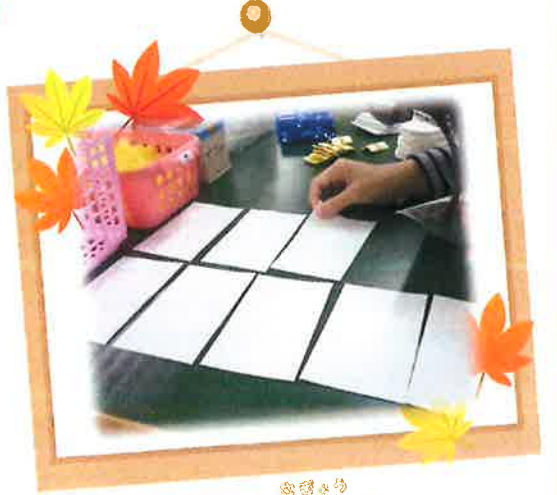
検定キットのセット作業や キャンパス別等、製作も行います。