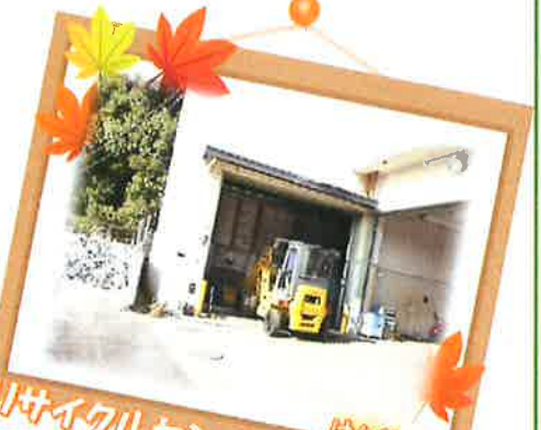
自転車センターの見学会 (次はどこへ見学に行こうか...?)