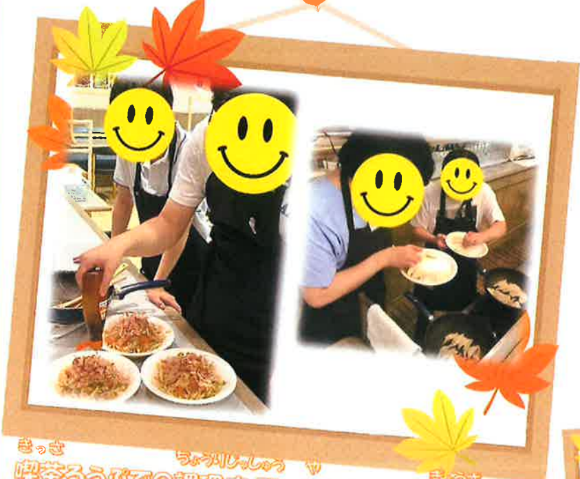
喫茶店での調理実習。焼きうどん、餃子など。 自分たちで作ったお昼ごはんは格別！